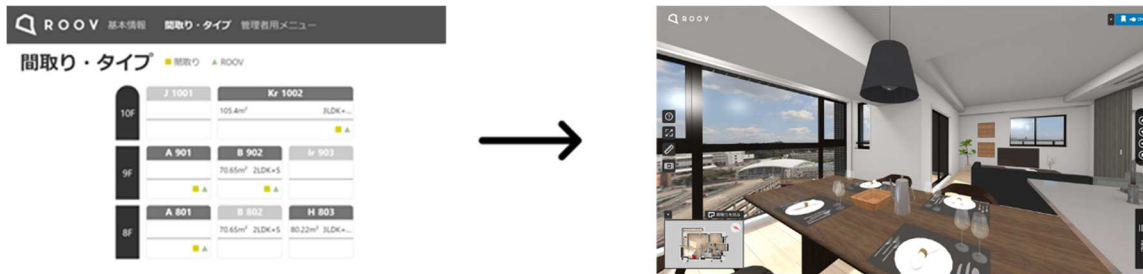
価格表から「ROOV®」内覧へとスムーズに移動

フロア別・タイプ別の販売価格表から、各部屋の間取タイプ、専有面積、販売価格等の定量的情報だけでなく、間取図の確認や「ROOV®」による内覧が行え、より接客効率とプレゼンテーション効果を高めます。